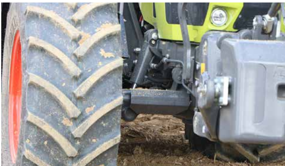
Pri novi generaciji serije Arion 600 Claas nudi tritočkovno vzmetenje sprednje preme s krmiljenjem ProActiv, ki preprečuje nihana pri vožnji v ovinek in poskakujočo vožnjo pri zaviranju ali speljevanju.

raciji serije Arion 600 ni drugače. Kabina je štiritočkovno vzmetena, poleg tega pa za čim manj tresljajev in sunkov skrbi še vzmetenje sprednje preme. Z novo generacijo Arion so namesto dosedanjega posameznega vzmetenja sprednjih koles uvedli novo, lastno tritočkovno vzmetenje. Klasično sprednjo premo proizvajalca Dana so vpeli na dva