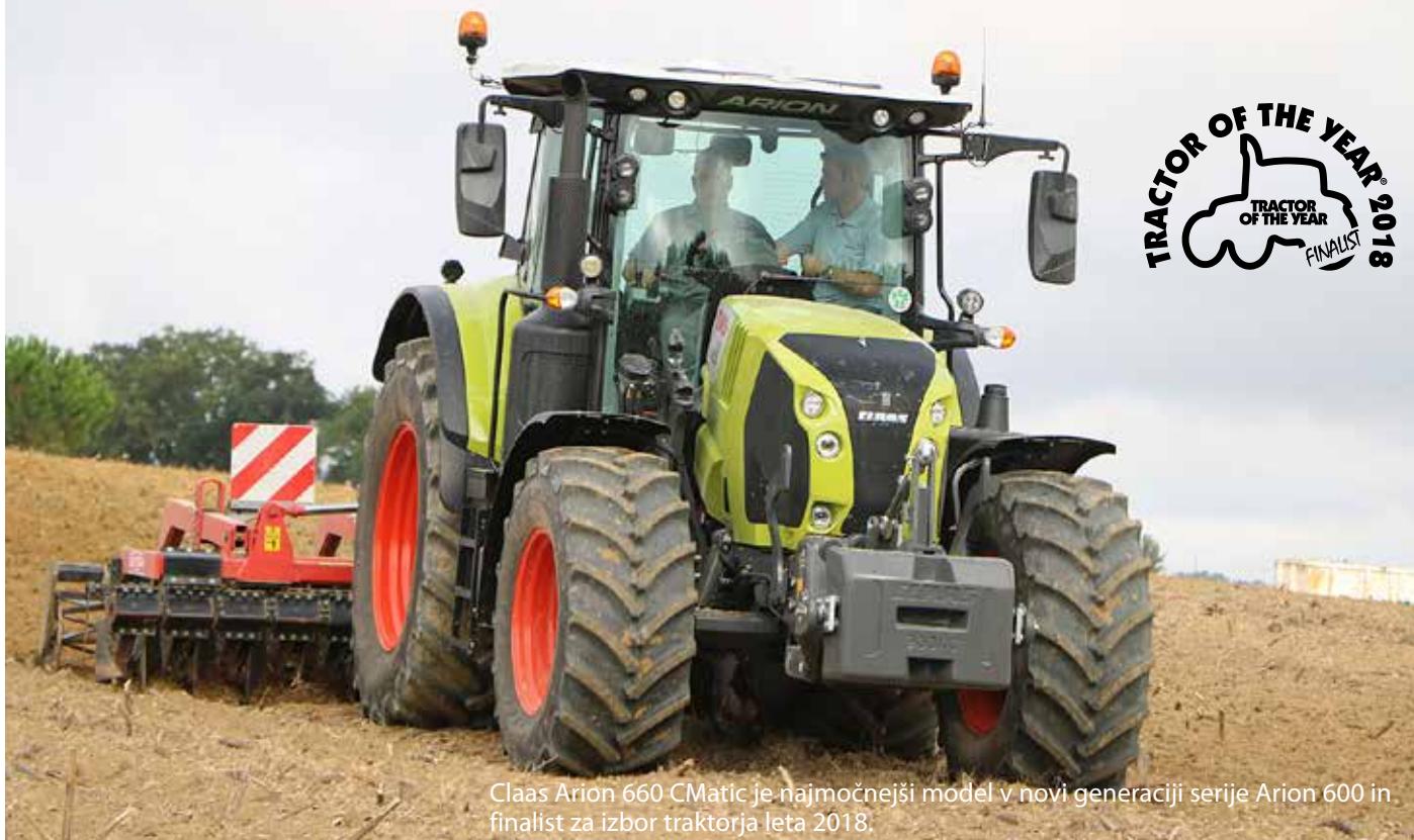
Claas Arion 660 CMatic je najmočnejši model v novi generaciji serije Arion 600 in finalist za izbor traktorja leta 2018.

V izboru za traktor leta 2018 je Claas v odprti kategoriji (Tractor of the year) kandidiral z modelom Arion 660 CMatic, ki je najmočnejši model v novi generaciji Arion 600, prenovljeni seriji traktorjev s šestvaljnimi motorji in zgornjega srednjega razreda po moči. V seriji so štirje modeli z maksimalno močjo od 145 do 185 KM (oz. 205 z dodatno močjo). Pri vseh modelih lahko kupci izbirajo med opremo CIS, CIS+ in CEBIS. Pri vseh izvedbah je na voljo menjalnik Hexashift, prestavljen pod obremenitvi, pri zadnjih dveh pa tudi brezstopenjski menjalnik CMatic. Izvedba CIS ima mehansko krmiljene hidravlične ventile in enostavnejši CIS zaslon, drugi dve izvedbi pa električno krmiljene hidravlične ventile in CIS barvni zaslon. Imata tudi poznano krmilno naslonjalo za desno roko z križno krmilno ročico za hidravlične ventile in krmilne naprave za menjalnik. Izvedba CEBIS ima tudi nov 12 colski barvni zaslon s krmiljenjem na dotik in intuitivnimi neposrednimi dostopi do menijev.